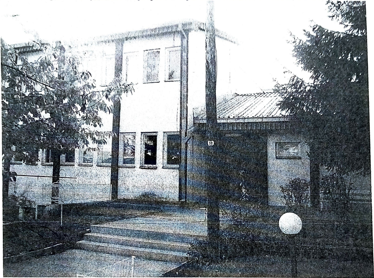
Центар за рехабилитација

Болницата има 10 болнички одделенија во кои се лекуваат пациенти од акутни и хронични душевни заболувања. Едно од овие одделенија е за лекување на алкохоличари а 1 за судскопсихијатриски случаи. Во склоп на болницата влегуваат: