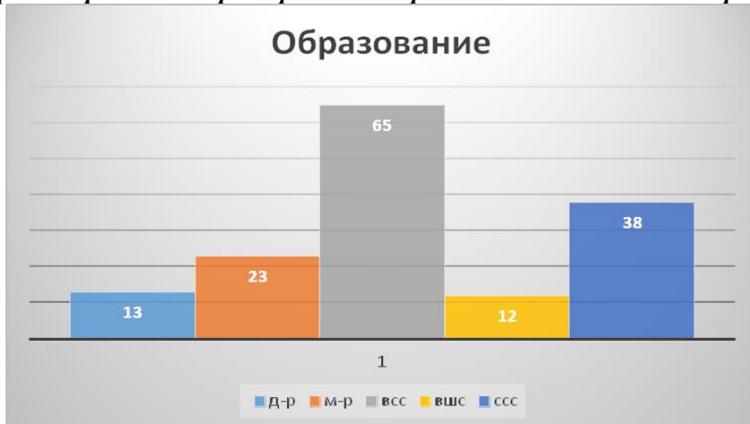
Графикон бр. 1. Табеларен приказ на образовното ниво на анкетираниите

Според образовната структура беа анкетирани: 13 доктори на науки, 23 магистри, 65 со високо образование, 12 со вишо и 38 со средно образование.