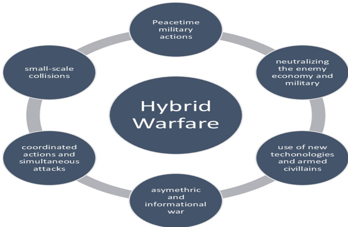
Слика 1. Спречување на хибридна војна (Ivanov, Shalamanov. 2020).

Република Северна Македонија, особено и поагресивно во периодот на преименување (Dimovski, 2024).