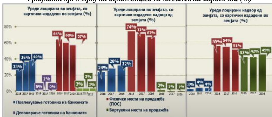
Графикон бр. 3 Број на трансакции со платежни картички (%)

Сите овие промени може да се забележат на следниот графички приказ: