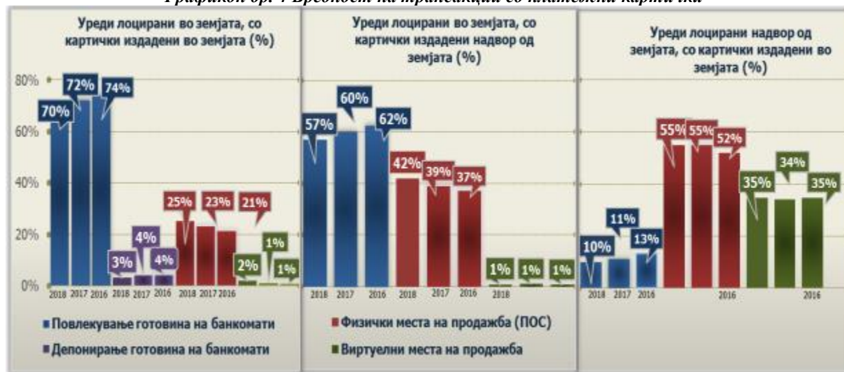
Графикон бр. 4 Вредност на трансакции со платежни картички

Овие промени можат да се согледаат на следниот графички приказ: