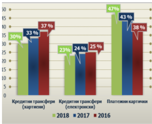
Графикон бр. 1 Учество на платежните картички во вкупниот број на безготовински трансакции во нашата земја во периодот 2016-2018 година (%)

Според податоците на Народна банка за 2018 година, вкупниот број на реализирани трансакции во 2018 година е за 11% повеќе споредено со вкупниот број на трансакции остварени во 2017 година, односно во 2018 година изнесува 114 милиони. Од вкупниот број на трансакции, најголемо учество, односно 47% му припаѓа на трансакциите со платежни картички за разлика од 2017 година, кога тоа учество беше 43%, додека во 2016 година учеството на платежните картички во вкупниот број на трансакции беше 38%. Тоа значи дека во анализираниот период од 2016 до 2018 година, се забележува значајно зголемување на учеството на платежните картички во вкупниот број на трансакции, односно од 38% во 2016 година на 47% во 2018 година. Тоа е резултат на се поголемо користење на платежните картички при плаќање во трговијата како од страна на физички лица, така и од страна на правни лица. Промените може да се согледаат на следниот графикон: