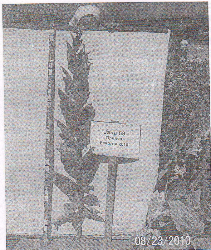
Слика 1. Јака 68 / Figure 1. Yaka 68