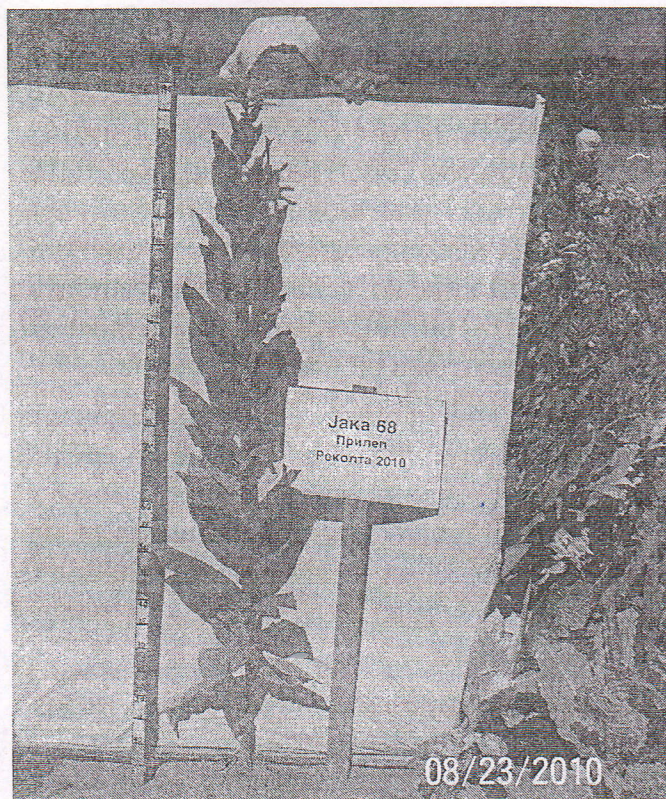
Слика 1. Јака 68 / Figure 1. Јака 68