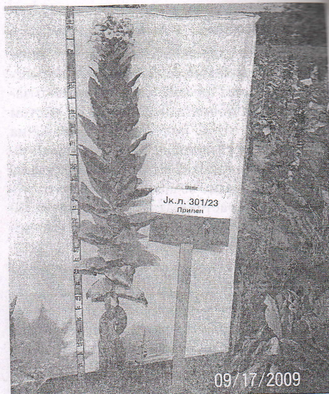
Слика 2. Јк л. 301/23 / Figure 2. Jk l. 301/23