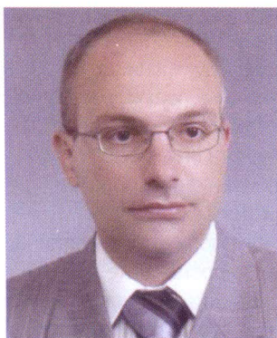
Проф. д-р Димитар Николоски