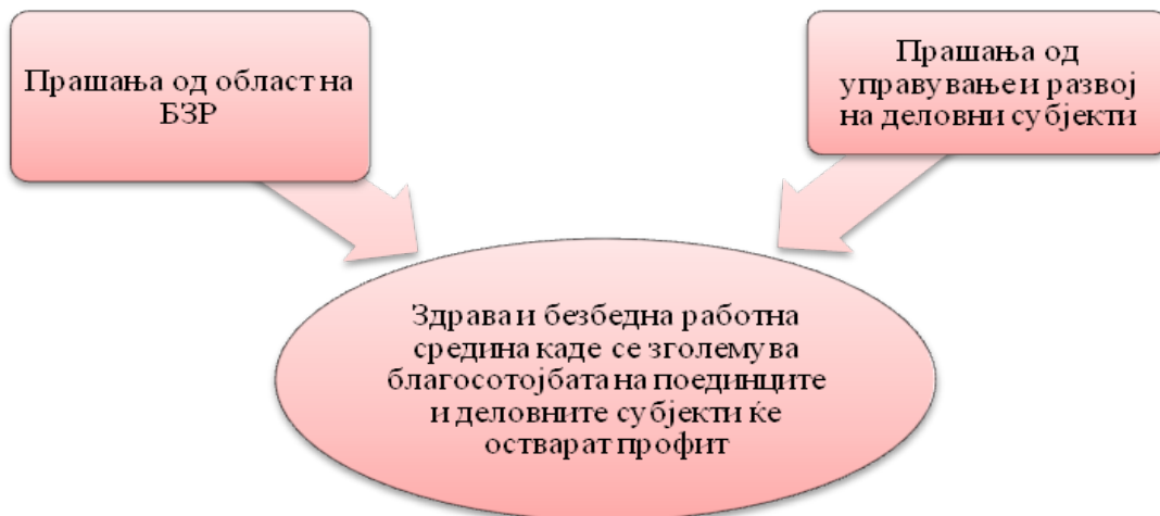
Слика 1. Поврзување на прашања од област на БЗР со тековно управување

и ефикасноста. Со добра организација на системот за безбедност и здравје може да се подобрат условите за работа а со тоа да се подобри продуктивноста. Подобрувањето на организацијата на работата, таа да се извршува поефикасно и во добра работна средина често пати може да се направи без поголеми капитални инвестиции а крајниот резултат да биде зголемување на нивото на безбедност на вработените и зголемување на нивото на дадени услуги и квалитетни производи.