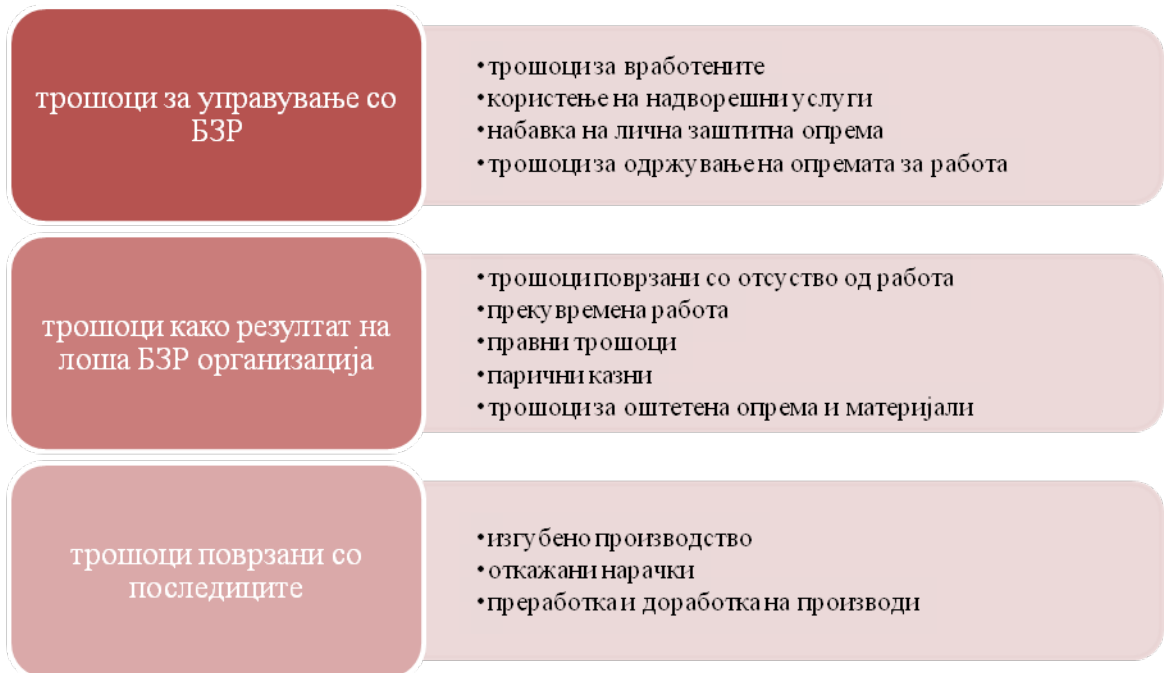
Слика 3. Резиме на трошоци

Врз основа на најчестите фактори кои влијаат на трошоците може да се направи преглед на трошоците на компанијата безбедноста и здравјето, со тоа што треба да се земе во предвид дека факторите се воопштени и за одредени ситуации некои фактори не треба да се релевантни или некои други може да се додадат. Ако сакаме да се направи годишен преглед, ситетрошоци поврзани со несреќите при работа во една година треба да бидат сумирани во еден вкупен извештај. Како прва група на фактори треба да се земат трошоците кои се јавуваат од управувањето со безбедноста и здравјето, односно тука спаѓаат трошоците на директниот персонал, користење на надворешни услуги, набавка на лична заштитна опрема, замена на производи и слично. Трошоците кои се јавуваат како резултат на лошата организација на БЗР е втората група на фактори кои треба да се земат во предвид. Тука се вбројуваат работни денови поврзани со отсуство од работа, прекумерната работа која должи на лошите работни услови, административни трошоци, правни трошоци, парични казни, надоместоци, трошоци за оштетена опрема и материјали, трошоци за истраги за настаната несреќа и слично. И на крај треба да се земат во предвид и последиците од несреќите за компанијата, како изгубено производство или откажани нарачки, квалитетни ефекти како преработка, поправки, отфрлањата или оперативни ефекти.