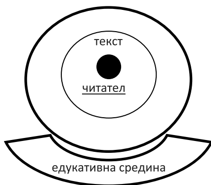
Слика 3. Некритички пристап за анализа на текст

бидат воведени промените предвидени со Националната програма за развој на образованието 68 , настојувањата и заложбите за активна позиција на ученикот во наставата остануваат само теориска претпоставка. Тоа значи дека анализата на текстовите не вклучува критичко мислење во вистинска смисла на зборот. Поаѓајќи од фактот дека текстот има само едно значење (објективистичките теории за рецепција на текст), целта на часот е таа: да се открие тоа значење. Без разлика дали се анализира уметнички или неуметнички текст, во наставата по литература или воопшто во наставата, анализата се сведуваše само на откривање на појавната страна на текстот, без подлабоко навлегување во неговата суштина.